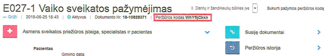
3 paveikslas. Sugeneruotas peržiūros kodas

Sistema sugeneruoja naują pažymos peržiūros e. sveikatos portale kodą, kuris parodomas atnaujintame medicininės pažymos peržiūros lange.