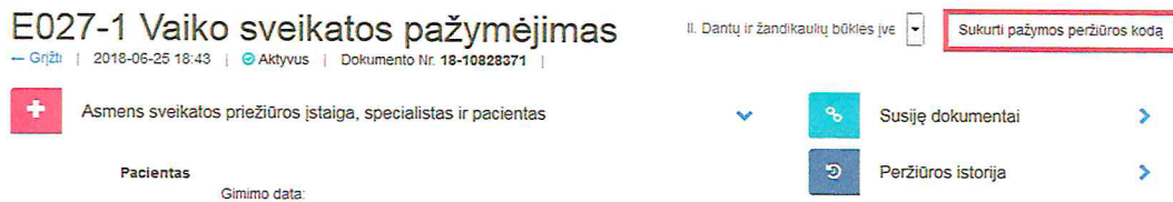
1 paveikslas. Sukurti pažymos peržiūros kodą